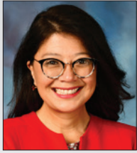
Karine Villa (D) facebook.com/ StateSenatorKVilla/