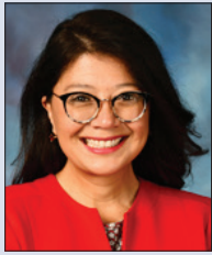
Karine Villa (D) facebook.com/ StateSenatorKVilla/